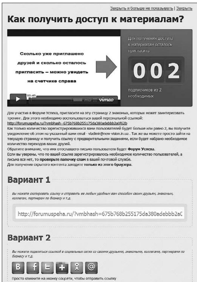
Рис. 11. Пример работы Viral Marketing Bomb

По поводу цены. Бесплатные опции есть на всех сервисах, так что тестируйте и пользуйтесь!